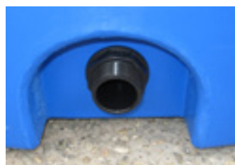
spodné šróbenie G2