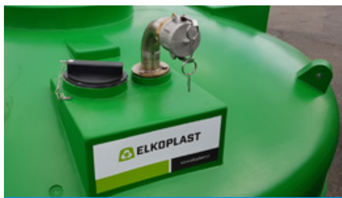
DC 9000 vrchné plnenie