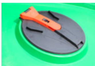
DC 9000 inšpekčný otvor 380 mm