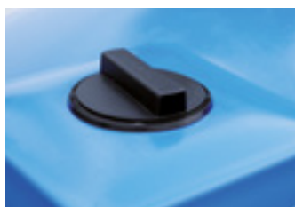
DC 5000/7000 plniaci otvor 112 cm