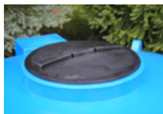
DC 5000/7000 inšpekčný otvor 540 mm