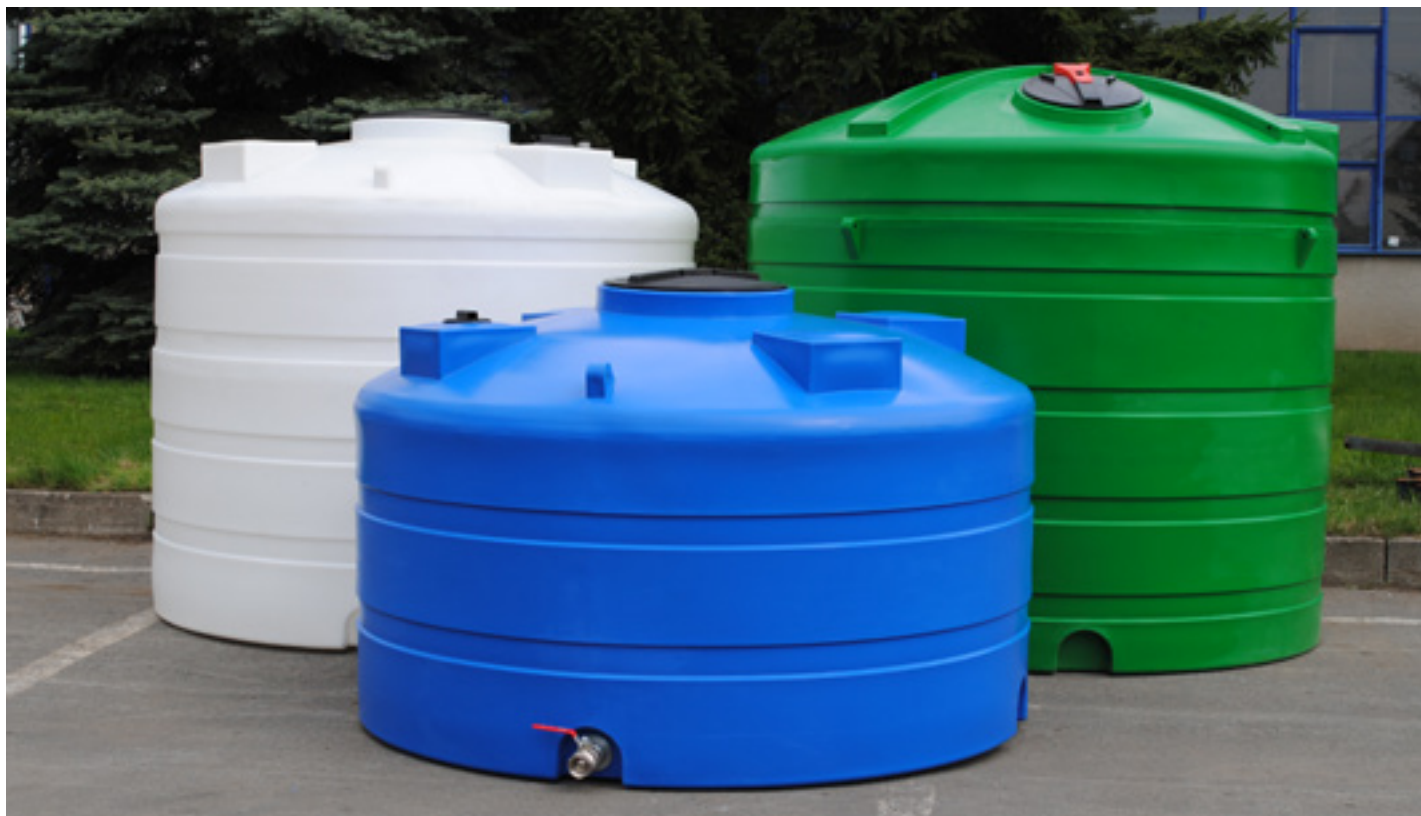
DC 5000, DC 7000, DC 9000