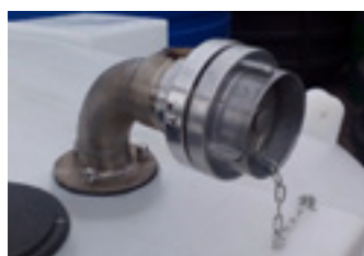
DC 7000 vrchné plnenie a sanie C