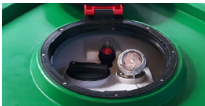
CDC 7000 vrchné plnenie pod vekom